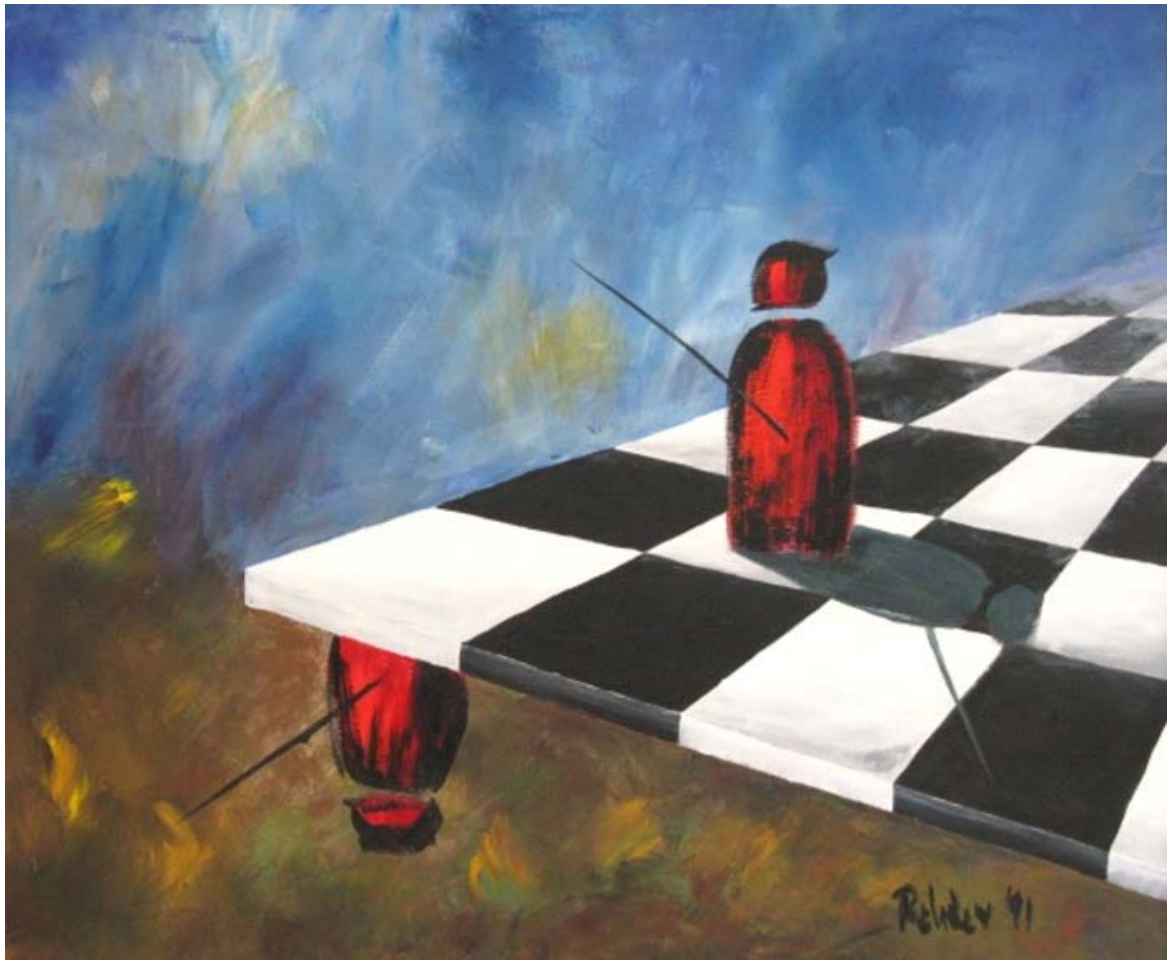
Ölbild: Elke Rehder