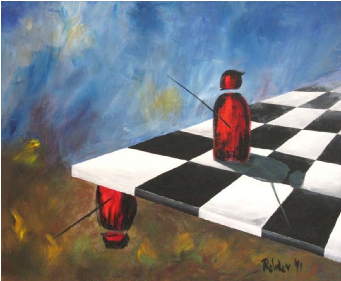
Ölbild: Elke Rehder