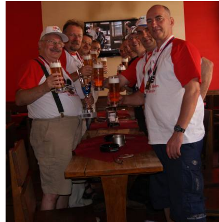
Das wurde gründlich gefeiert!

Durch die Bedenkzeitbegrenzung auf 30 Minuten je Spieler bleibt uns im Gesamtrahmen der Veranstaltung genügend Zeit, um neben den obligatorischen kulinarischen Genüssen (tschechisches Bier, Böhmisches Knödel) auch einige kulturellen Sehenswürdigkeiten aufzusuchen: